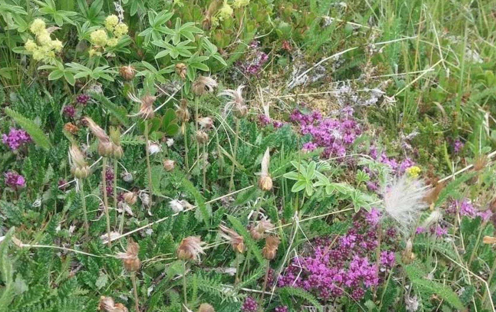
Fjölbreyttur gróður er í Hólmanesi

eins og hvalbök eru vitnisburður um skriðstefnu jökulsins. 3 Bannað er að raska jarðminjum innan svæðisins, á þetta einnig við um nýjar og óþarfa vörðuhleðslur.